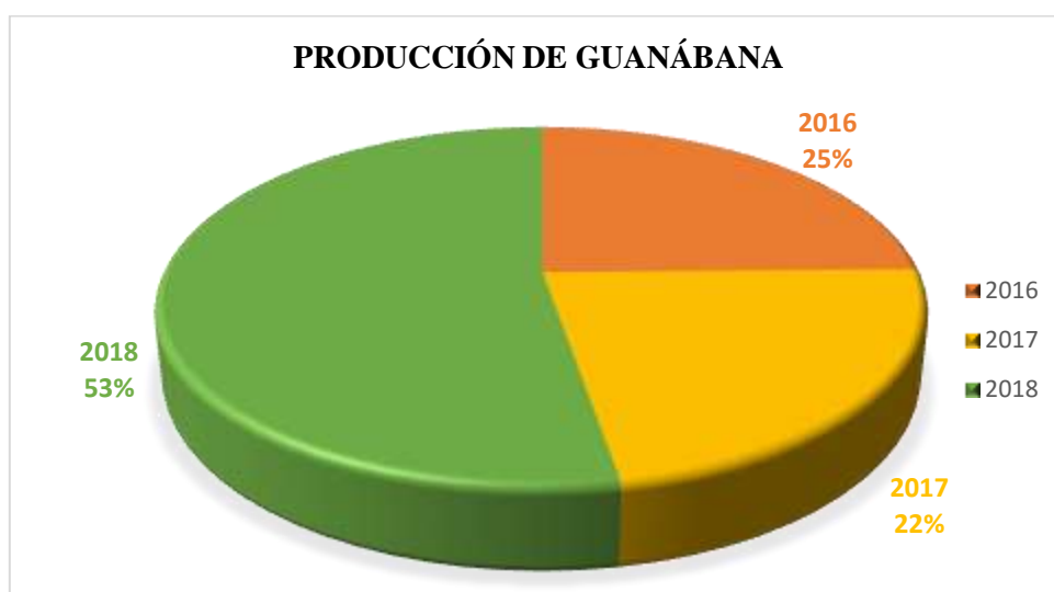
Gráfico 1-3. Producción de guanábana.

En el gráfico 1 se detalla la producción de guanábana obtenida en los últimos años, ubicándose el año 2018 con una producción del 53%, superior al año 2016 con el 25% y finalmente seguido del año 2017 con una producción inferior a las anteriores con el 22%.