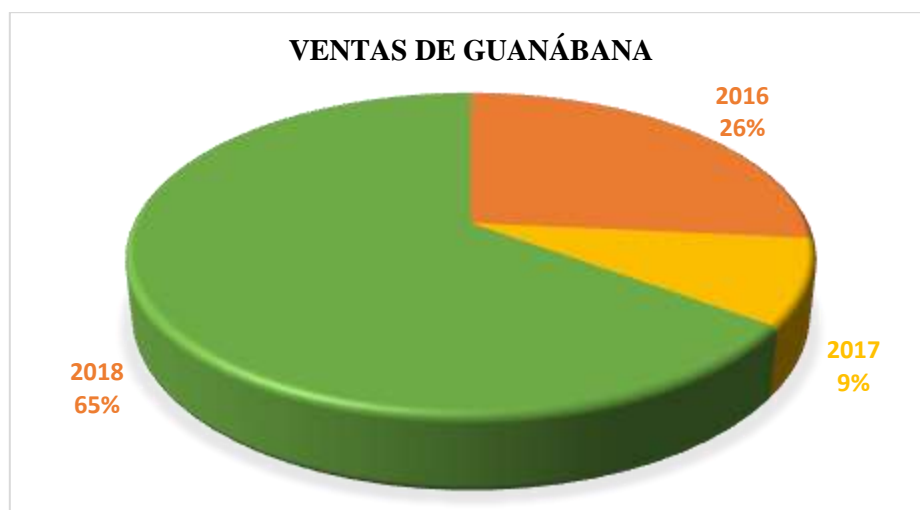
Gráfico 2-3. Ventas de guanábana.

En el gráfico 2 se observa las ventas de guanábana generadas entre los últimos años, en donde el año 2018 tiene el mayor porcentaje de ventas con el 65%, seguido del año 2016 con el 26% y finalmente el año 2017 tiene el porcentaje más bajo en ventas con apenas el 9%.