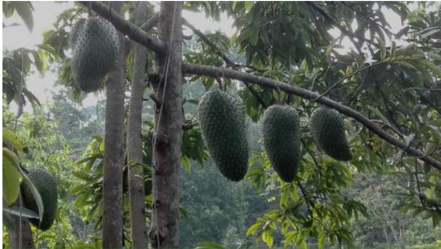
Figura 1-1. Árbol y fruto de guanábana.

En la figura 1-1. Se encuentra el árbol y fruto de guanábana.