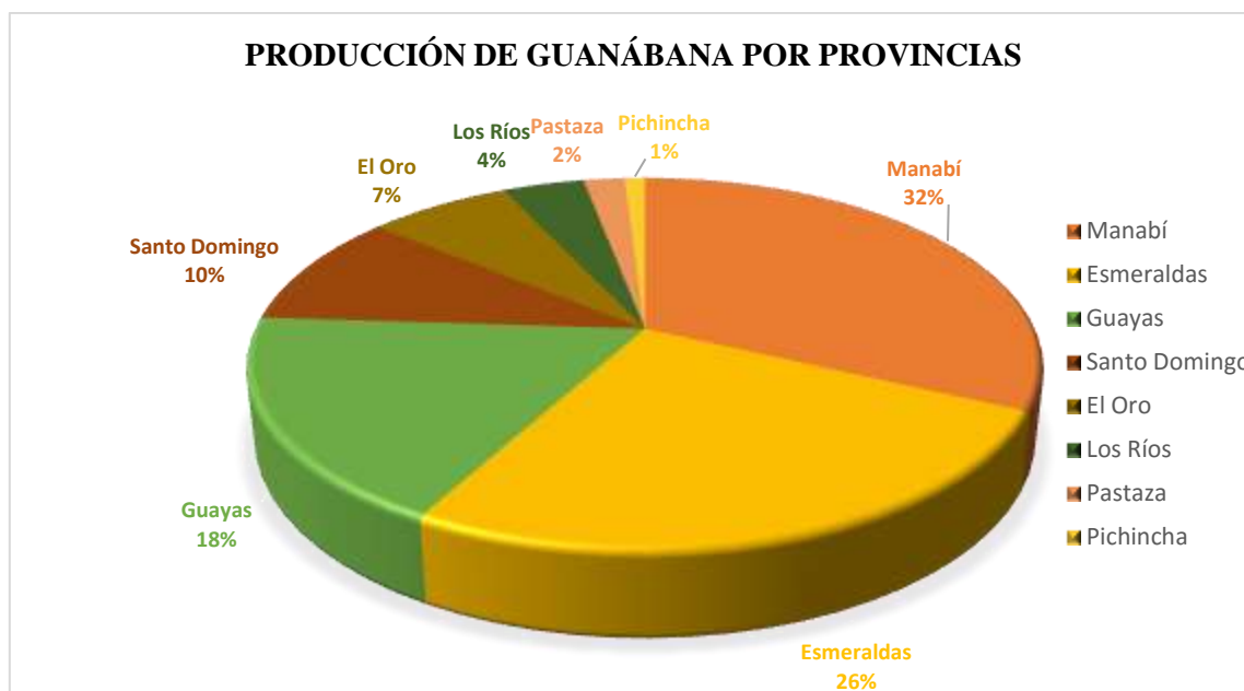
Gráfico 4-3. Producción de guanábana por provincias.

En el gráfico 4-3. Se expresa la producción de guanábana por provincias en el País, teniendo a la provincia de Manabí como la mayor productora de guanábana con el 32%, seguido de la provincia de Esmeraldas con el 26% y Guayas con el 18%, siendo estos los valores más altos debido a la topografía de las tierras y las condiciones que estas brindan para que tenga un correcto desarrollo los cultivos. No obstante, los valores más bajos se centran en las provincias de Santo domingo (10%), El Oro (7%), Los Ríos (4%), Pastaza (2%) y Pichincha (1%).