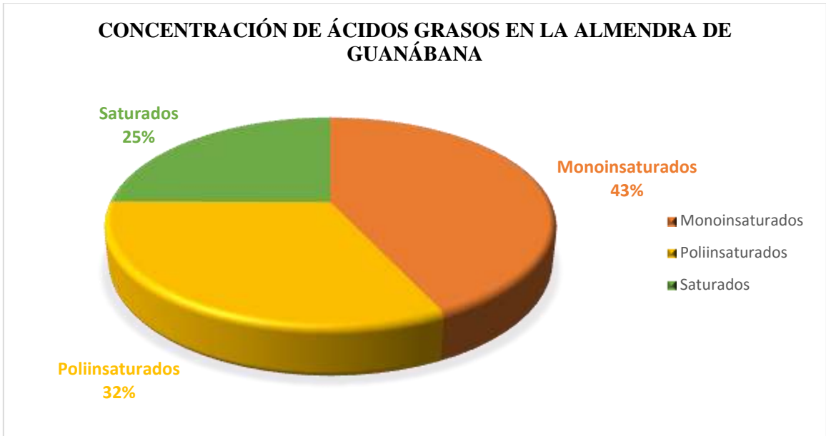
Gráfico 6-3. Concentración de ácidos grasos en la almendra de guanábana.