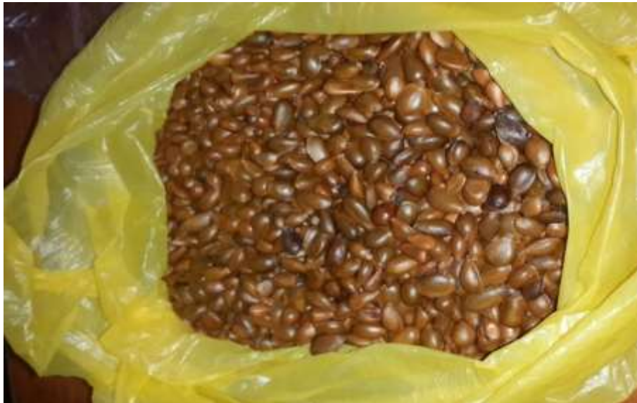
Figura 2-1. Semillas de guanábana ( Annona muricata ).

En la figura 2-1: Se encuentra las semillas o almendras de guanábana.