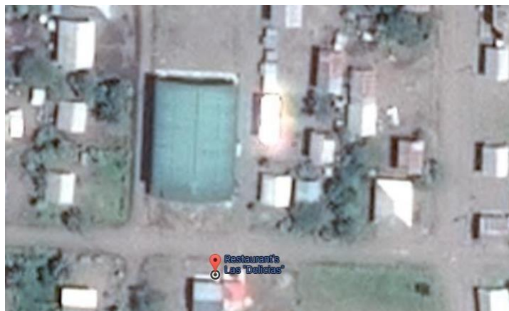
Figura 1-3: Ubicación de la Agropecuaria PCA.