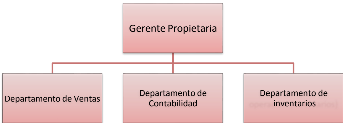
Figura 4-3: Organigrama de puestos